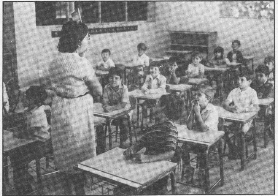
Os profesores aparecen como responsables de implantar a xornada única nos centros.

Para o mestre permite un mellor perfeccionamento profesional